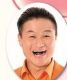
ティモンディ 高岸 宏行さん

日時/2024.8.18(日) 会場/福井県産業会館 2号館 内容/ティモンディ高岸宏行さんによる運動に関するトークショー 健康的な生活習慣(運動・食事)セミナー ウォーキング姿勢の対面指導と実践など