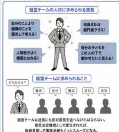
●図2 後継者が育つ経営チーム

後継者不足による倒産が年々増加している中小企業。少子化の今、親族内での承継にこだわってはいは事業が立ちゆかなくなる。そこで、後継者難倒産を回避するための親族外事業承継の仕方を解説する。